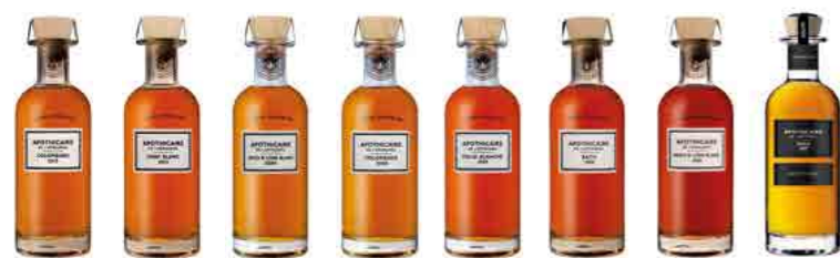
L'APOTHECAIRE DE L'ARMAGNAC p.21 ARMAGNACS FOR CONNOISSEURS