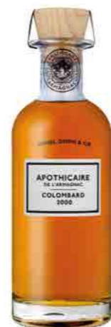
COLOMBARD 2000 BAS ARMAGNAC 43.8%