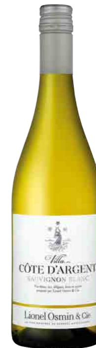
VILLA CÔTE D'ARGENT IGP CÔTES DE GASCOGNE

CLASSIC - SUCCULENT - MEATY APPROACHABLE - BLACK FRUIT DARK STONE FRUIT - SPICE