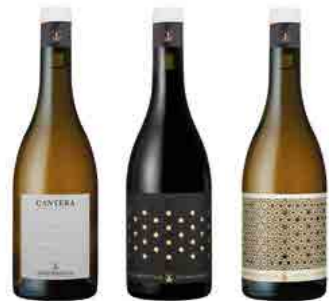
LES CUVÉES CRÉATIVES p.13 WE ARE REINVENTING THE SOUTHWEST...