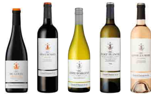
LES VILLAS p.11 AUTHENTIC VARIETAL WINES WITH A MODERN EXPRESSION