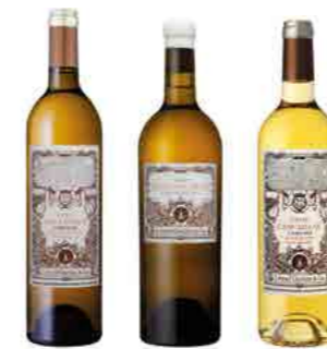
CLOS CANCAILLAÛ & DE LA VIERGE p.23 GREAT PYRENEAN TERROIRS