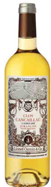
CLOS CANCAILLAÛ LE DERNIER CARRÉ

VIBRANT - PURE - COMPLEX - CHISELLED YELLOW FRUIT - MINERALITY