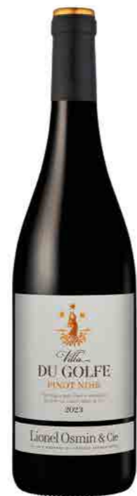
VILLA DU GOLFE IGP CÔTES DE GASCOGNE

LES VILLAS, CONTEMPORARY WINES THAT ARE ELEGANT AND EASY TO ENJOY.