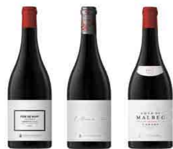
LES APPELLATIONS p.17 OUR HISTORIC TERROIRS, EXPRESSED WITH BOLDNESS & ELEGANCE...