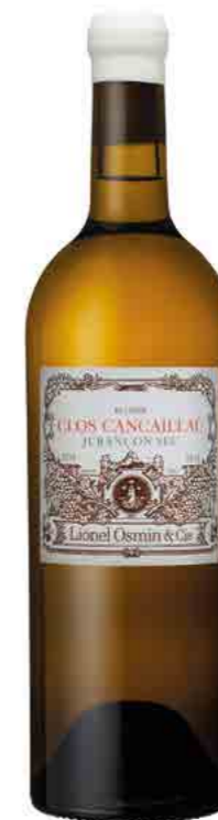
CLOS CANCAILLAÛ AU LAVOIR

MINERAL - GENEROUS - INTENSE UPRIGHT - CITRUS - WHITE FRUIT