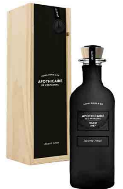
JOLIETTE FINISH LIMITED SERIES OF 400 BOTTLES Exceptional bottles that combine the magic of Joliette with the timelessness of Armagnac.