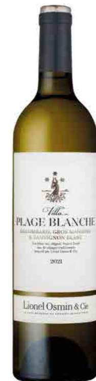
VILLA PLAGE BLANCHE IGP CÔTES DE GASCOGNE COLOMBARD GROS MANSENG SAUVIGNON BLANC

MODERN - EXUBERANT - FRESH - VARIETAL CITRUS - HONEYSUCKLE - MENTHOL