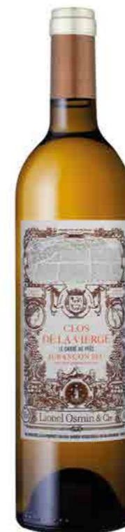
CLOS DE LA VIERGE LE CARRÉ DE PEES

AOP JURANÇON SEC VINES AVERAGE AGE 50 YEARS GROS MANSENG ESTATE HVE 3