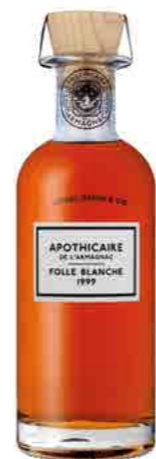
FOLLE BLANCHE 1999 BAS ARMAGNAC 49.0%