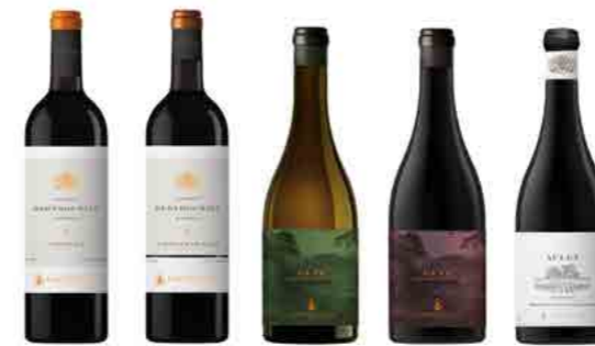
DOMAINE BERTHOUMIEU p.27 OUR VISION OF A HISTORIC TERROIR