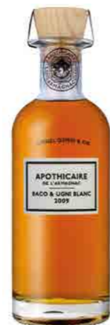
BACO & UGNI BLANC 2009 BAS ARMAGNAC 59.2%