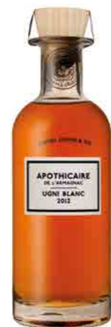
UGNI BLANC 2012 BAS ARMAGNAC 57.8%