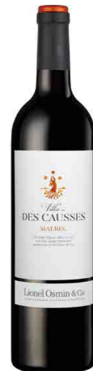
VILLA DES CAUSSES IGP COMTÉ TOLOSAN

SOFT - SMOOTH - CHARMING JOVIAL - CHERRIES - SPICE