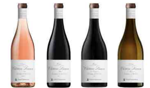
CHÂTEAU LAUROU p.29 THE TEMPLE OF THE NEGRETTE GRAPE