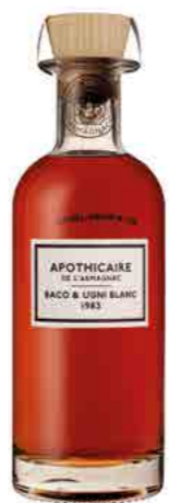
BACO & UGNI BLANC 1983 BAS ARMAGNAC 49.5%