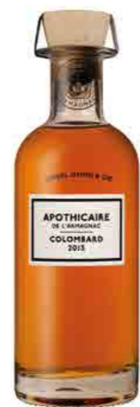
COLOMBARD 2013 BAS ARMAGNAC 57.0%