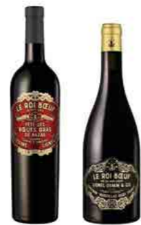
LE ROI BŒUF: BAZAS & AUBRAC p.15 OUR COMMITMENT TO INDIGENOUS BREEDS...