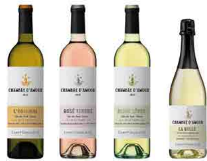
CHAMBRE D'AMOUR p.9 NEW GENERATION WINES