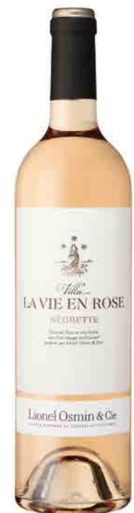
VILLA LA VIE EN ROSE IGP COMTÉ TOLOSAN

VERSATILE - OCEANIC - INTENSE - FRUITY POMELO - PEACH - LIME