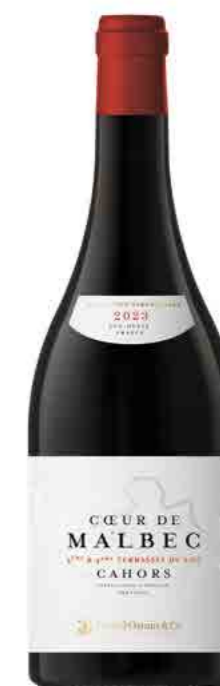
CŒUR DE MALBEC AOP CAHORS MALBEC

MEATY - WELL-BALANCED - AMIABLE - ACCESSIBLE PEONIES - POTPOURRI - SPICY