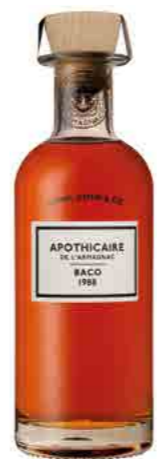
BACO 1998 TÉNARÈZE 52.9%