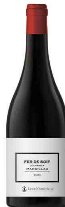
FER DE SOIF AOP MARCILLAC MANSOIS

DRINKABILITY - SAPID - QUAFFABLE ORIGINAL - FLORAL - PIQUILLO PEPPER MENTHOL