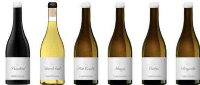
LE CONSERVATOIRE p.19 RARE VARIETALS FROM THE SOUTHWEST OF FRANCE