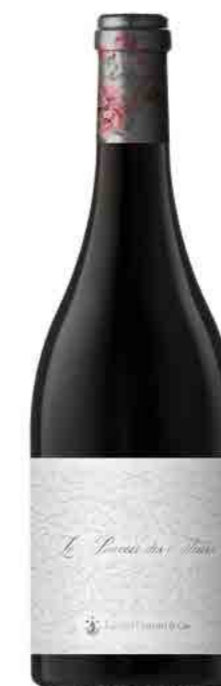
LE POUVOIR DES FLEURS AOP FRONTON NÉGRETTÉ SYRAH

DRINKABILITY - SAPID - QUAFFABLE ORIGINAL - FLORAL - PIQUILLO PEPPER MENTHOL