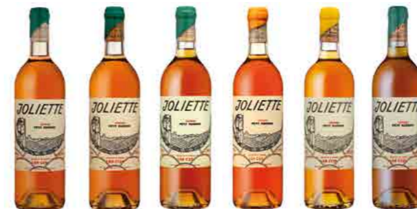
CLOS JOLIETTE p.31 THE LEGENDARY WINE OF THE SOUTHWEST OF FRANCE